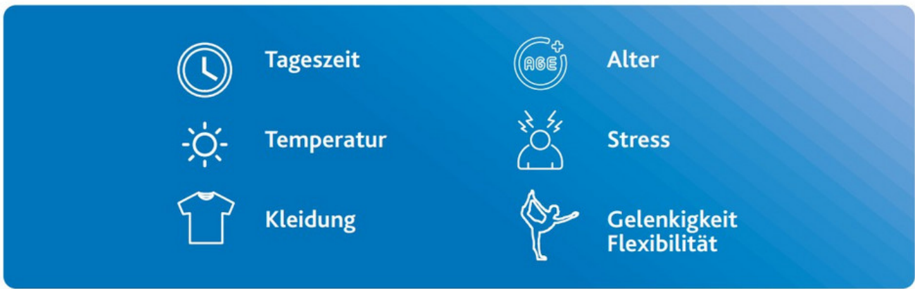
Abbildung 17: Einflussfaktoren auf die Beweglichkeit – personenexterne Faktoren (links) und personeninterne Faktoren (rechts).